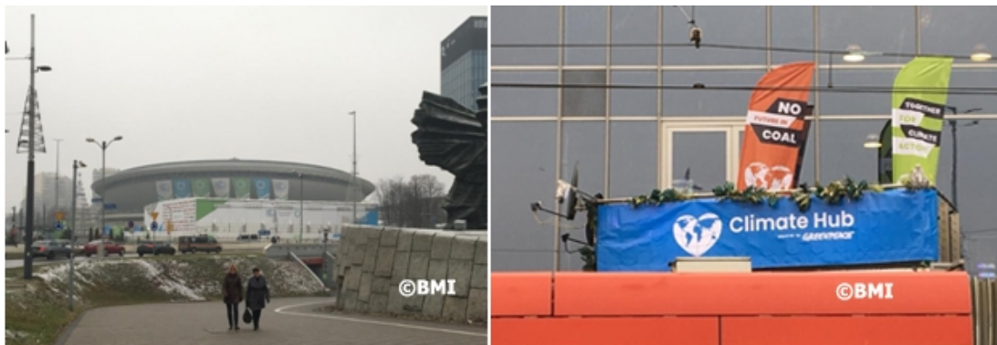
El lugar de la COP 24, el Centro de Convenciones de Katowice (izq.); diciendo “no” a un futuro del carbón (dcha.) en la estación del transporte público.

constatar un avance substancial en el proceso de negociación: Los 196 países miembros de la Convención Climática acordaron las reglas de juego (reglamento o rule book ) para la implementación del Acuerdo de París . Para muchos observadores, este ha sido un resultado sorprendente, considerando los pocos avances obtenidos en las negociaciones previas del último medio año.