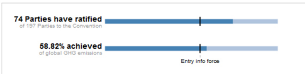
Gráfico de las Naciones Unidas mostrando que más de 55 países responsables por más del 44% de las emisiones ya han ratificado el Acuerdo de París

Con este proceso récord, el Acuerdo de París ya entrará en vigencia el 4 de noviembre de 2016 , unos días antes de la próxima Conferencia Climática COP 22 en Marrakech, Marruecos.