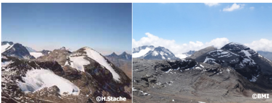
El Niño siempre acelera el retroceso de los glaciares en el país. Cerro Chiar Kherini en 1995 (izq.) y 2012 (dcha.)

Hasta la fecha, los impactos de este El Niño en el país han sido relativamente moderados. Sin embargo, en Bolivia, ya ha cobrado una primera víctima: se secó por completo el segundo mayor cuerpo de agua, el Lago Poopó.