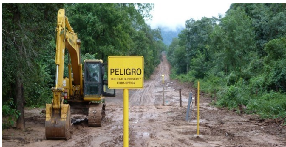
En el PNYANMI Serranía de Aguaragüe; foto de CEDIB, año 2012

Este decreto señala en su Art. 2, párrafo I, que “Se permite el desarrollo de actividades hidrocarburíferas de exploración en las diferentes zonas y categorías de áreas protegidas...” lo cual afectaría a aquellas que tienen superpuestos contratos petroleros y áreas reservadas a YPF, estas últimas que también pueden disponerse para que otras empresas puedan realizar operaciones a través de contratos de servicios petroleros. Los datos muestran que aproximadamente el 17% de la superficie total de las áreas protegidas nacionales estarían bajo influencia de la nueva frontera petrolera, la cual ahora cuenta con una superficie aproximada de 24 millones de hectáreas, representando a cerca del 22% del país 2 .