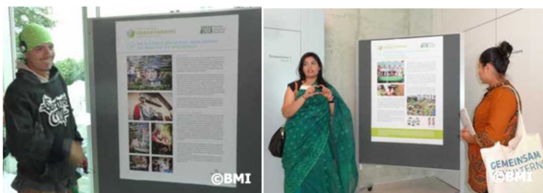
Participantes de Colombia (izq.) y Bangladesh (dcha.) presentando sus posters.

AKA , uno de los voceros de AgroArte en Medellín, Colombia, presentó su proyecto de agricultura urbana enfocado en el encuentro, la lucha contra la violencia, mediante el hip hop . “Así como las plantas crecen en suelo fértil, este colectivo surge desde la Comuna 13 para construir tejido social, resistencia, memoria y seguridad alimentaria”, comenta.