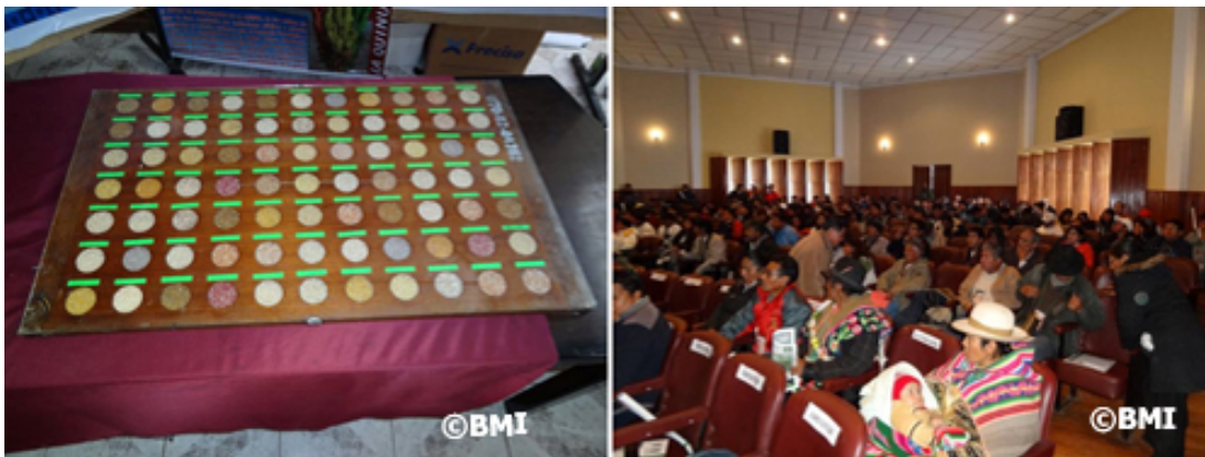
Diversidad genética de la quinua (izq.) y una vista de los asistentes (der.)

El Simposio se caracterizó por la presencia de productores nacionales e invitados del exterior, asociaciones de productores, investigadores nacionales e internacionales y personas interesadas en la temática, por lo que la metodología empleada en el mismo permitió que las exposiciones sean a partir de experiencias propias de los productores como también de los resultados de investigaciones científicas, entablando mesas de debate con el público presente.