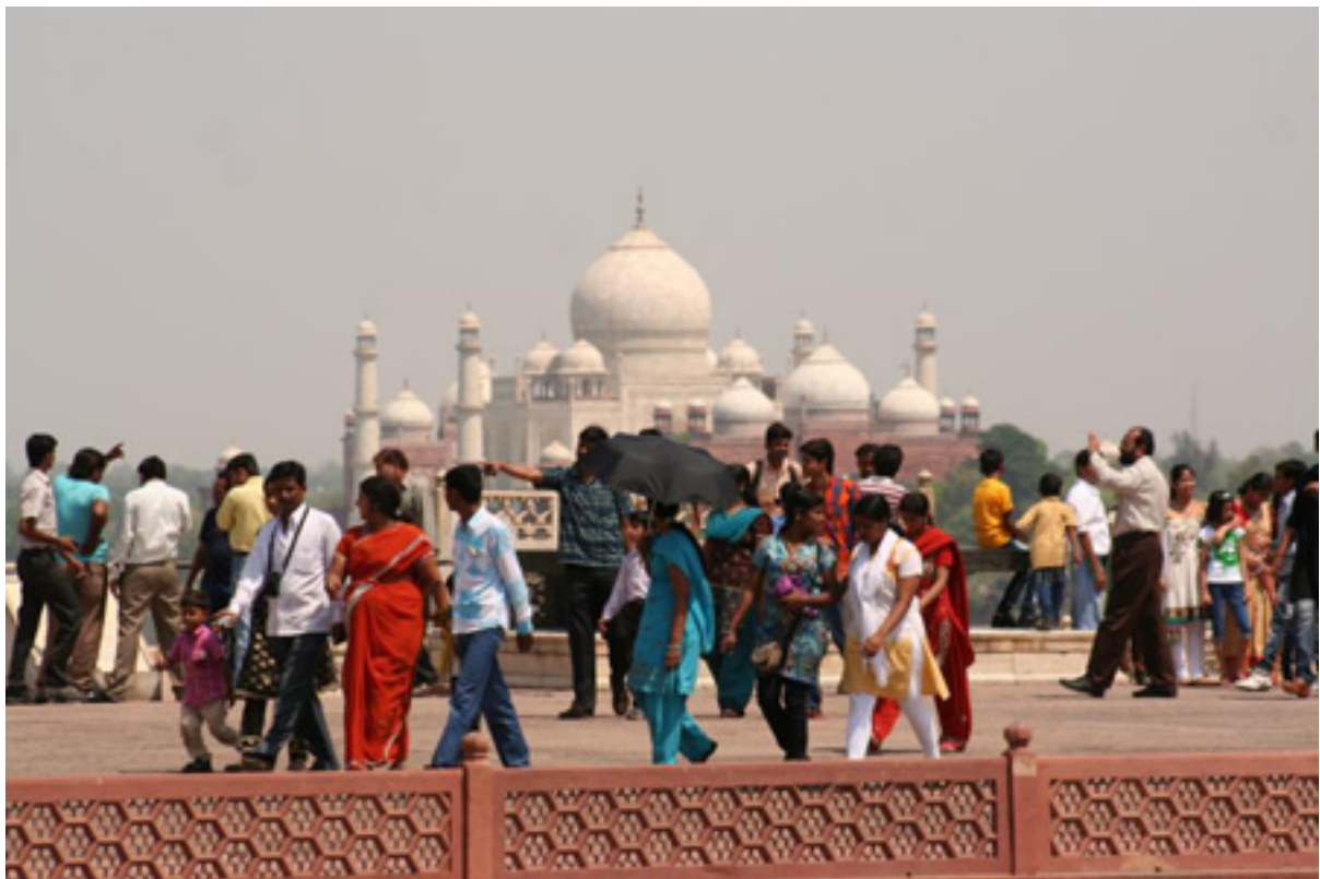
Nueva Delhi, India